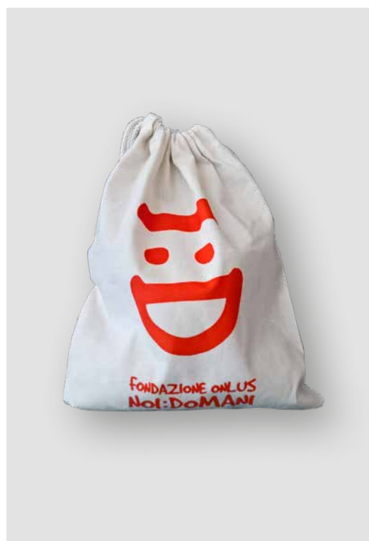
SACCHE DI STOFFA PICCOLE

Alcuni prodotti possono essere personalizzati in collaborazione con i ragazzi dei centri educativi per disabili.